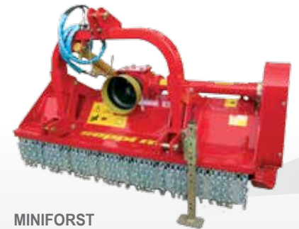
MINIFORST modello forestale classico senza dispositivo pick-up richiede 55 - 90 CV alla pdf trincia arbusti e ramaglia fino a 12 cm Ø

Trinciatrici robuste con dispositivo pick-up e griglia per trinciare potatura in modo fine e omogeneo.